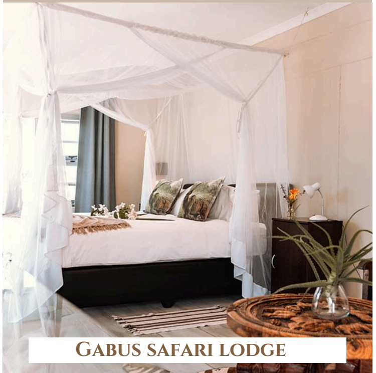
GABUS SAFARI LODGE

Die Lodge liegt inmitten von Savannen- und Buschlandschaften, umgeben von beeindruckenden Bergketten. Hier lebt eine vielfältige Tierwelt, unter anderem Giraffen, Antilopen und Zebras. Die familiengeführte Lodge wurde 1995 gegründet und legt großen Wert auf eine persönliche Atmosphäre und bietet den Gästen ein komfortables Aufenthaltserlebnis mit echtem „Zuhause-Gefühl“.