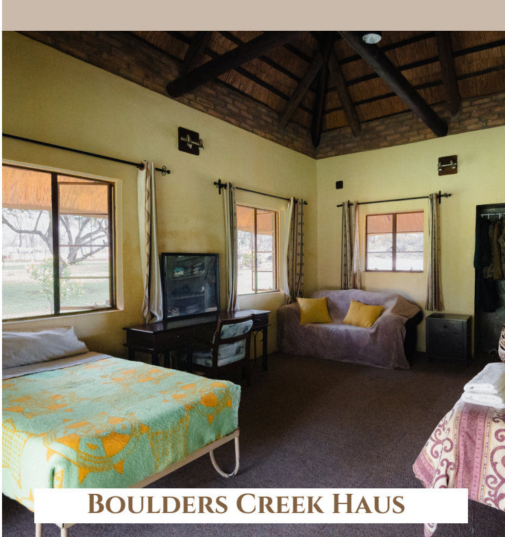
BOULDERS CREEK HAUS

Das Boulders Creek Haus ist quasi das Hoof&Travel Haus. In dieser Unterkunft verbringen auch alle unsere WorkingHoliday Teilnehmer ihre Zeit. Dieses Haus liegt etwa 20 Minuten vom Haupthaus entfernt und bietet einen wunderschönen Ausblick auf den Bach, in dem die Nilpferde leben. Zur Verfügung stehen Drei- und Vierbettzimmer mit geteiltem Bad. Die Abende können wir gemeinsam an der gemütlichen Feuerstelle am Haus ausklingen lassen.